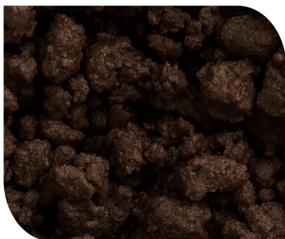
R192.V1 Crumble gusto cioccolato. Secchiello - 2 kg