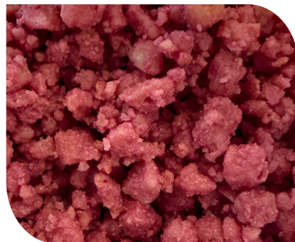
R191.V1 Crumble gusto lampone. Secchiello - 2 kg