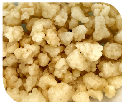
R193.V1 Crumble gusto cioccolato bianco. Secchiello - 2 kg